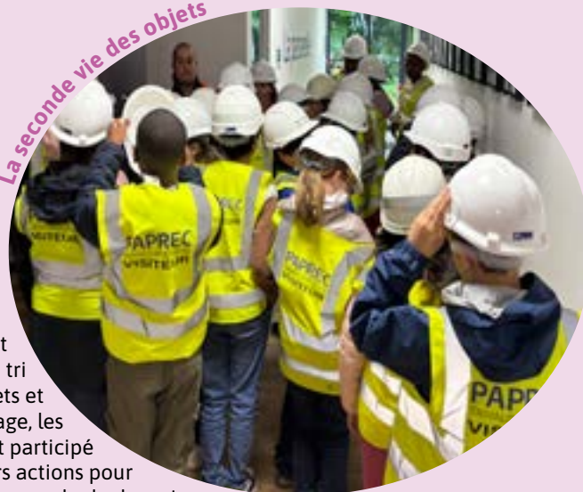
La seconde vie des objets

Dans le cadre de leur projet autour du tri des déchets et du recyclage, les élèves ont participé à plusieurs actions pour mieux comprendre le devenir des objets et l'importance de réduire ses déchets. Ils se sont rendus en avril, à Rennes, pour participer à une course d'orientation originale sur le thème de la seconde vie des déchets. Munis d'une carte, les élèves ont parcouru le centre-ville à la recherche de différents lieux permettant de donner une nouvelle vie aux objets : "Le Relais", brocante, repair corner... Cette animation faisait suite à un premier atelier mené en classe avec "La Feuille d'Érable" autour du tri des déchets et du réemploi. En mai, ils ont poursuivi ce projet en visitant l'usine de recyclage Paprec. À travers des jeux, des échanges et des explications adaptées, ils ont découvert le parcours des déchets : de leur collecte jusqu'aux différentes étapes de tri et de recyclage. Les élèves ont également pu se mettre dans la peau des agents de tri grâce à une activité ludique leur demandant de trier eux-mêmes différents déchets. Ces expériences concrètes ont permis de rendre plus réel le geste de tri au quotidien et de sensibiliser les élèves à l'importance du recyclage et du réemploi pour protéger l'environnement.