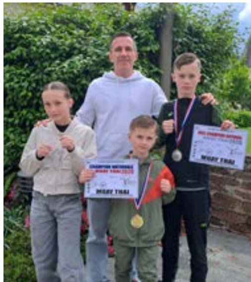
En septembre 2025, motivés par leurs quatre cousins de Saint-Grégoire eux-mêmes licenciés au club Naga Team,

En à peine un an de pratique de boxe thaï au club de la Naga Team à la Mézière, trois montgermontais ont déjà fréquenté le ring en niveau national !