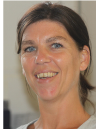
Mme Bot est arrivée à l'école élémentaire en CE1.